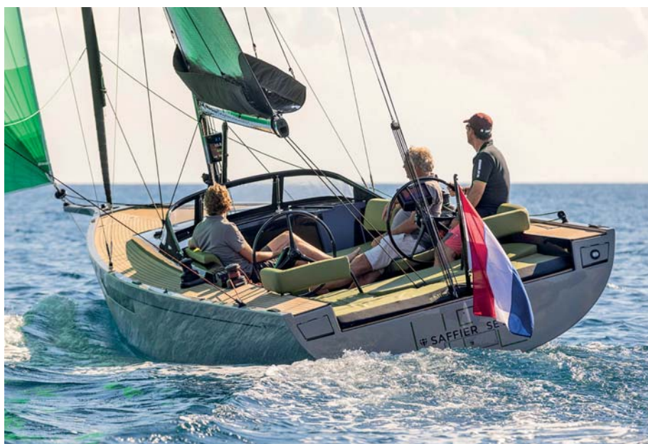
Pour le plaisir. Chaque nouveau Saffier élève encore le niveau de prestation qui en fait la référence des dayboats. Finitions, vitesse et confort sont au top.

On l'a dit cette catégorie des «Special Yachts» est un peu fourre-tout. Mais c'est aussi celle qui nous donne à voir les bateaux les plus originaux et souvent les plus intéressants. Cette année, nous avons pu essayer l'étonnant Révolution 24 qui a souffert d'une finition hâtive, le surprenant Sunbeam 32.1 dont les performances n'étaient malheureusement pas au niveau de son originalité ni de sa finition et le très beau De Cesari 33, tout de bois moulé et d'élégance, à défaut d'être un vrai bateau de série. Il a fallu arbitrer entre deux voiliers sans doute moins originaux mais tous les deux très aboutis. Un petit trimaran très amusant pour sortir à la journée ou pratiquer la petite croisière. Et un grand dayboat rapide et chic aux emménagements contraints mais soignés. Et si le monocoque l'emporte (voir essai pages suivantes), on n'a pas voulu laisser le très méritant trimaran sans récompense.