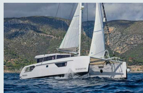
Windelo 50. Le jury a salué l'effort du constructeur dans sa démarche d'écoconstruction.