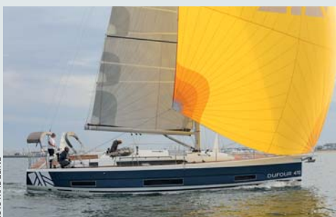
Elvstrøm eXP. Un tissu à voile étonnant à base de matériaux recyclés, très convaincant sur le Dufour 470.