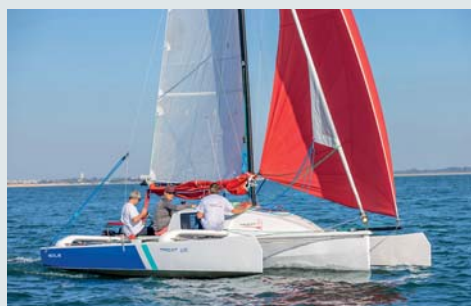
Tricat 6.90. Plate-forme rigide et poids plume participent au bon comportement de ce petit croiseur.