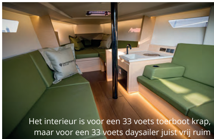
Het interieur is voor een 33 voets toerboot krap, maar voor een 33 voets daysailer juist vrij ruim

sleepte de boot al een nominatie voor European Yacht of the Year in de wacht (de zesde nominatie voor de werf). Tijdens BOOT Düsseldorf in januari moet duidelijk worden of Saffier de zoveelste prijs in de wacht mag slepen. Daysailers zijn hot en dat weten ze in IJmuiden. Never change a winning formula zullen ze gedacht hebben. Al is die formule wel meegegaan met de tijd.