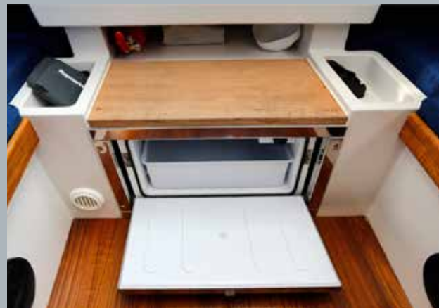
De vakjes aan weerszijden van de kajuittrap zijn bijzonder praktisch.