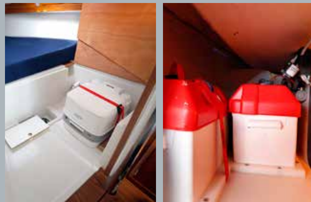
De scharnierende klep over het toilet heeft een haakje extra nodig.