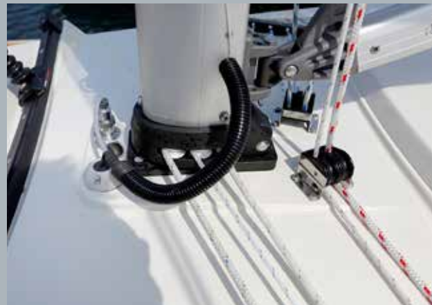
De kabeldoorvoer is tegen schavielen beschermd.