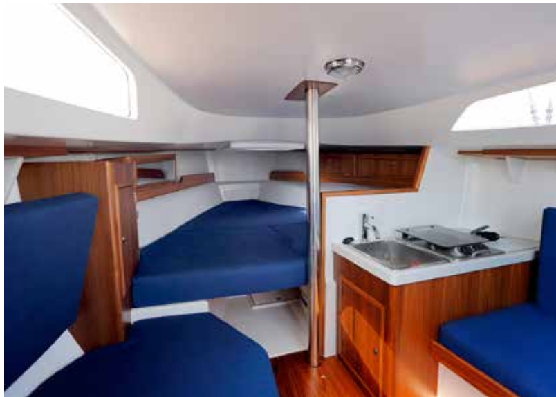
Met eenvoudige kombuis, toilet achter het schot en royale bedden.