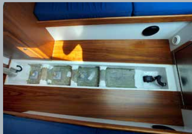
De afwatering is uitstekend. Rechts het mini-bilgeputje.